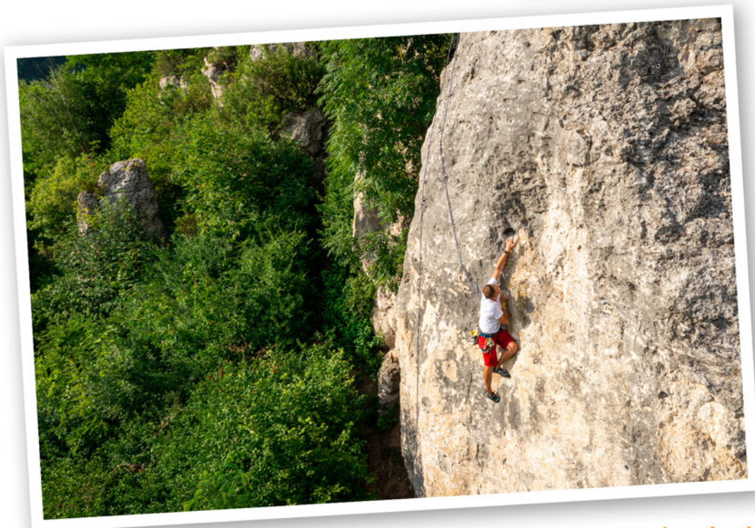
Wspinaczka skałkowa Oferujemy sprzęt i instruktaż.